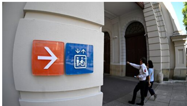
Menschen mit Behinderung haben es schwer am Arbeitsmarkt

Ein neues Bündnis von Sozialorganisationen und Unternehmen warnt vor Kürzungen bei Unterstützungsmaßnahmen für Menschen mit Behinderung am Arbeitsmarkt. Nötig sei eine verlässliche Finanzierung der bestehenden Strukturen, die Absicherung des Ausgleichstaxfonds (ATF), der Mittel zur beruflichen Inklusion bereitstellt, und eine Stärkung inklusiver Bildung, forderte das "Bündnis für Inklusion am Arbeitsmarkt – Chancenreich" am Montag bei einer Pressekonferenz in Wien.