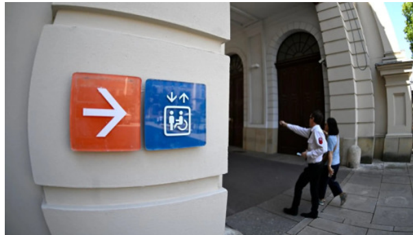
Menschen mit Behinderung haben es schwer am Arbeitsmarkt

Veröffentlicht: von Agenturen Ein neues Bündnis von Sozialorganisationen und Unternehmen warnt vor Kürzungen bei Unterstützungsmaßnahmen für Menschen mit Behinderung am Arbeitsmarkt.