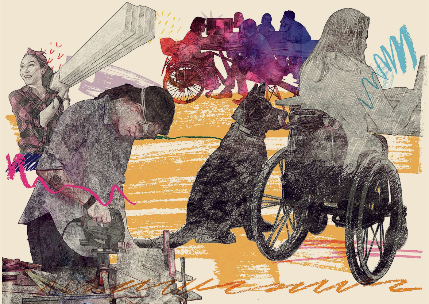
ILLUSTRATION: DER STANDARD/FATH AYDOĞDU

Dahinter stehen Organisationen und Dachverbände wie Caritas Österreich, Dachverband Berufliche Inklusion Austria, Diakonie Österreich, KOBV Österreich, Lebenshilfe Österreich, ÖZIV und Zero Project sowie Unternehmen wie Ikea Österreich, Interspar, die Rewe Group und die Post.